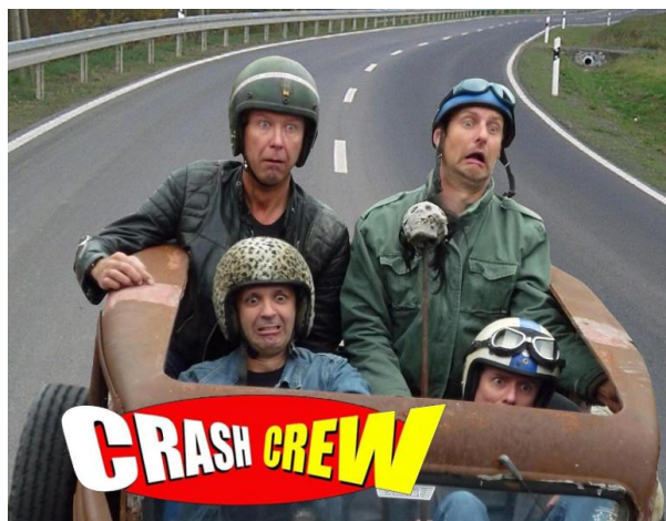
Rock ´n´ Roll on the road: Die Crash Crew am 29.7.2016

Am Freitag rockt die „ CRASH CREW “ mit fetzigem Rock´n´Roll und Pubrock die Bühne – frei nach dem Motto: „Für gute Musik brauchts nicht viel mehr als gute Songs, Motivation und Bier.“ Das alles gibt's in perfekter Weise beim Ustersbacher Bier.Sommer.Festival. Also Helme auf und ab geht die Vollgas-Fahrt mit den „Rock´n´Rollern im besten Alter“, wie sich die Augsburger Jungs auch treffend bezeichnen.