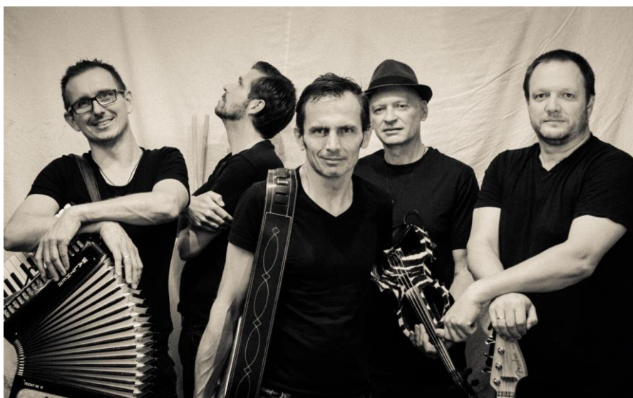
The Seer: Vorfreude auf das Heimspiel im Augsburger Land am 29.7.2016