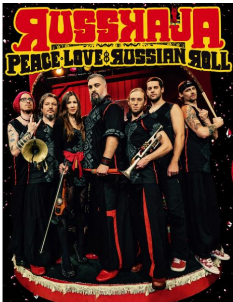
Bringen am Samstag, 30.7.2016 die Ustersbacher Brauerei zum Beben: Russkaja

Jazz und Frank Zappa-Rock. Und nennt es russische Turbopolka. Russkaja ist sehr russisch. Mit einem großen Augenzwinkern. Das kommt davon, wenn Russen mit Ukrainern, Bulgaren und Wienern eine Band gründen. Dazu Auftritte auf dem Chiemsee Reggae, Sonnenrot Festival und weiteren 30 Festivals europaweit. Ein Widerspruch? Eher eine Ansage...